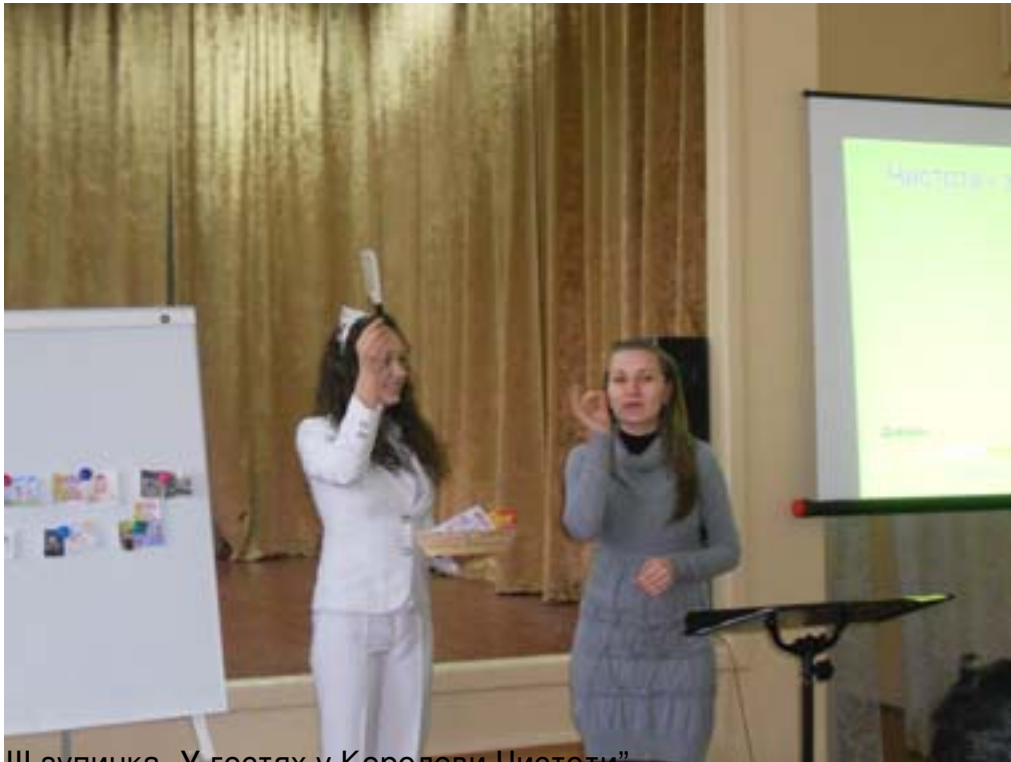
Шлюбчик. У гостях у Королеви Чистоти”