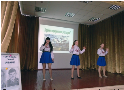
Загальношкільний захід «Чернобиль: від мирного атома до катастрофи»