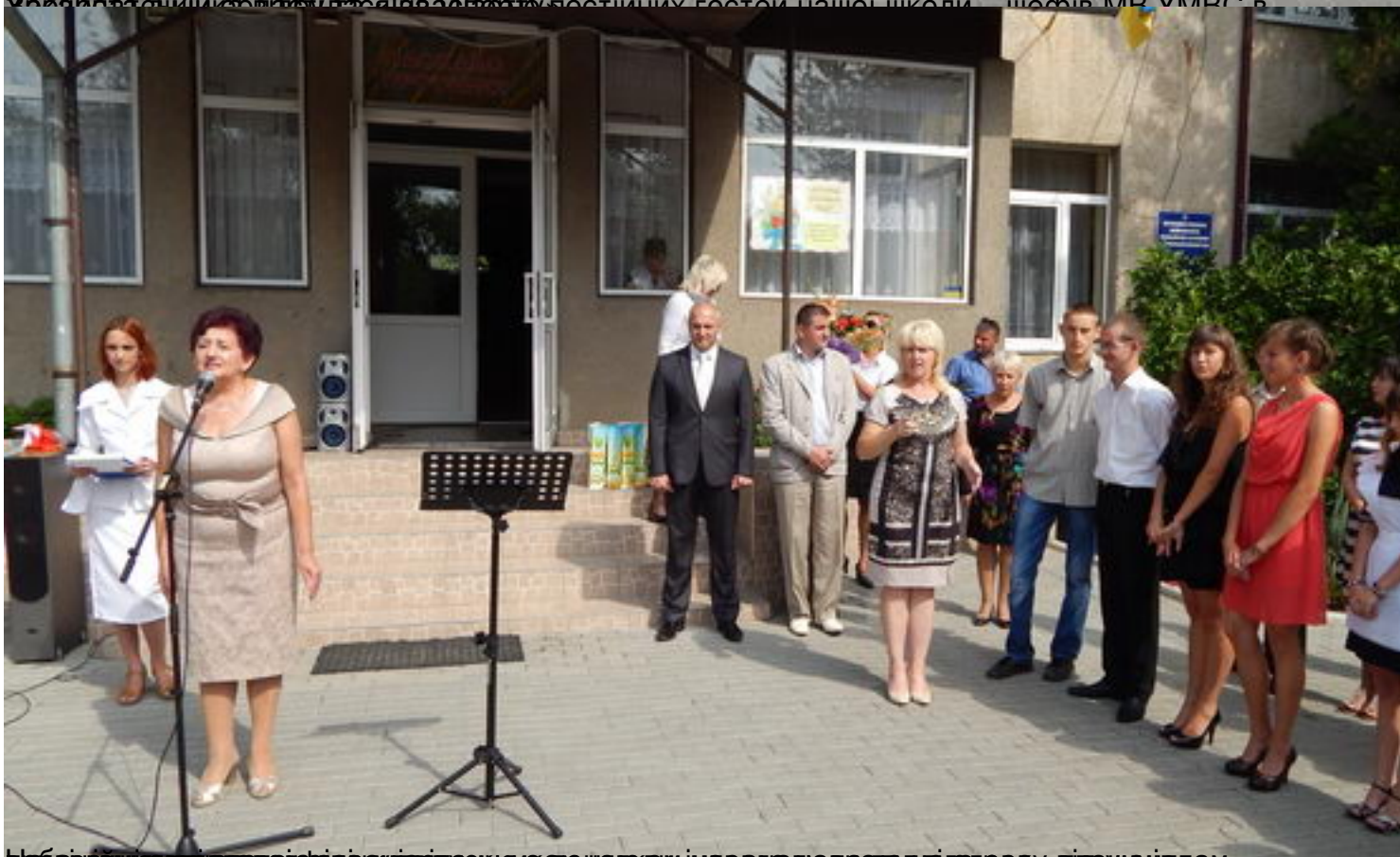
Вибачившись за догоду, організували зустріч з автором інноваційного проекту «Відчуй, там» -