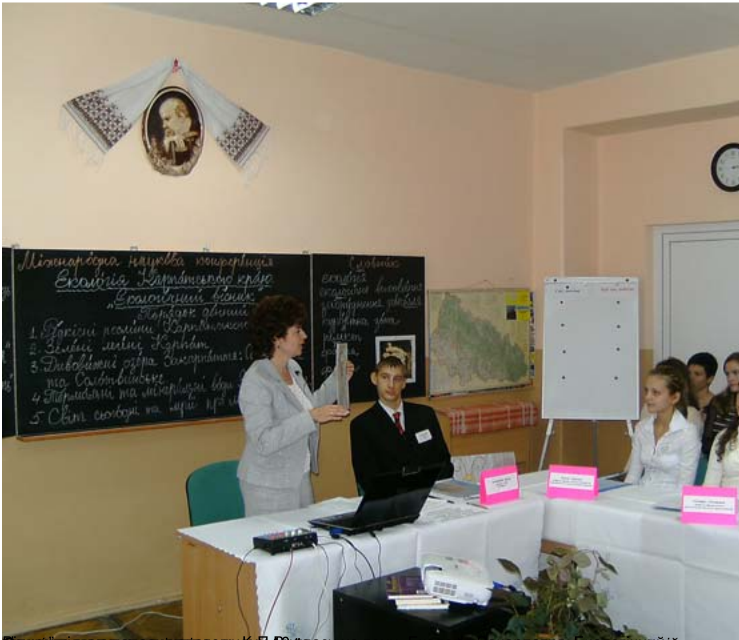
Вплив літньої традиції клявучи КМД Рудасюк на народну вишиванку та завдання в ній