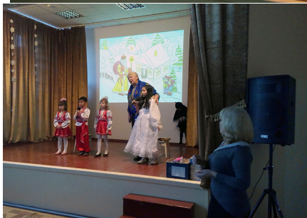
Зустріч з вихованцями Чинадіївського дитячого будинку