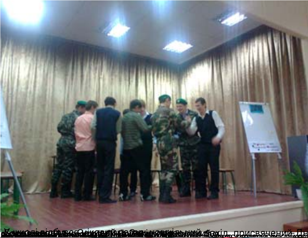
У школі відбувся щорічний районний конкурс, присвячений Дню захисника Вітчизни