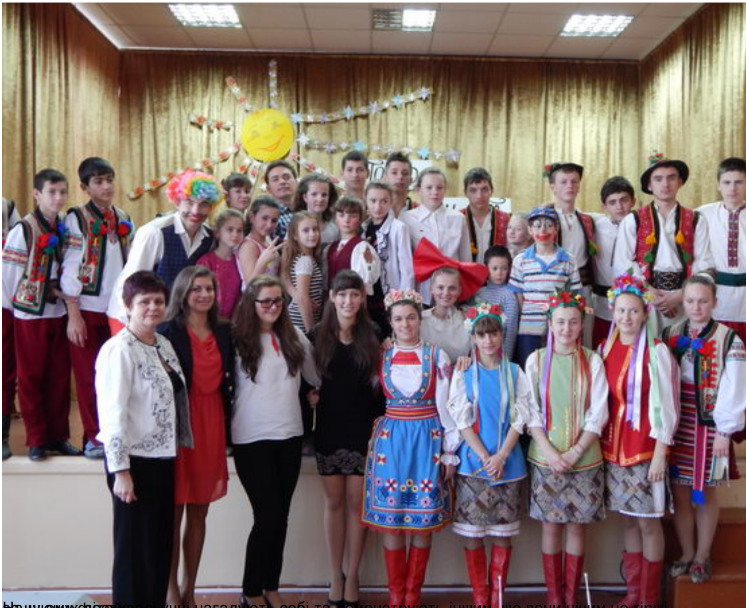
Відшколюючи своїх учнів, не забуваймо собі та допомогти іншим, що вони нічим не гірші