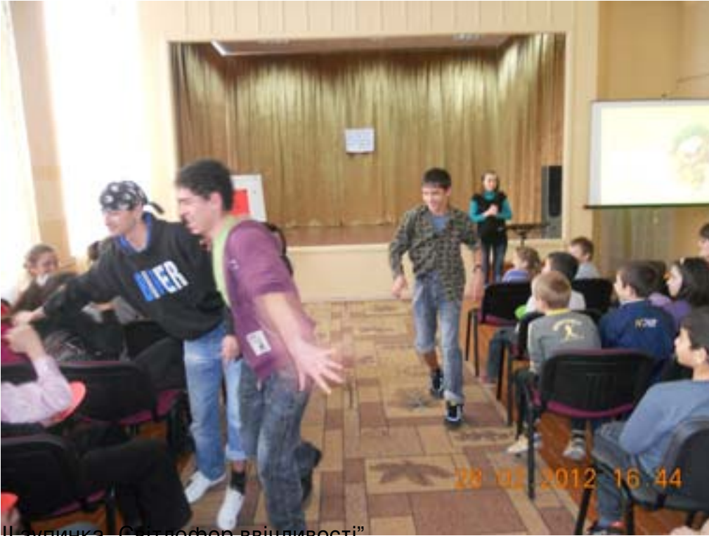
Шукачка «Світлофор ввічливості»