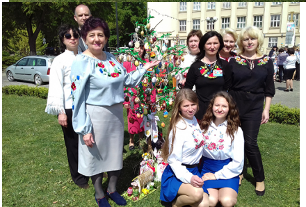
Участь у Другому фестивалі-конкурсі «Воскресни, писанко!»