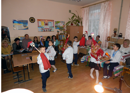
Відкрите виховне заняття з позакласного читання «Скарби українського народу»