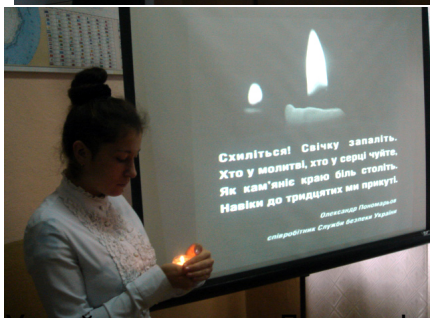
Усний журнал до Дня пам'яті жертв голодоморів «Україна пам'ятає!»