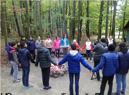
Національний день «Виховання про ліс у лісі» до ландшафтного парку «Березинка» та НПП