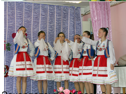
Закарпатській обласній організації УТОГ – 70!