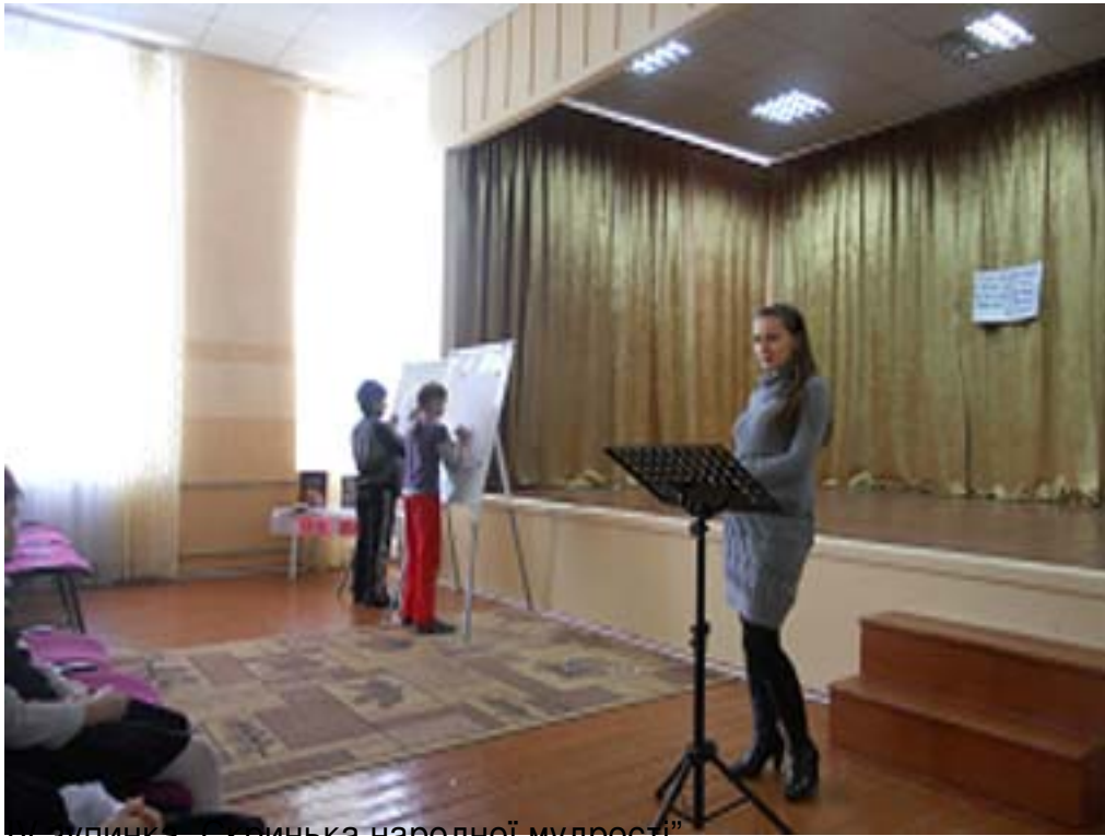
у звучанні «Світличка народної мудрості»