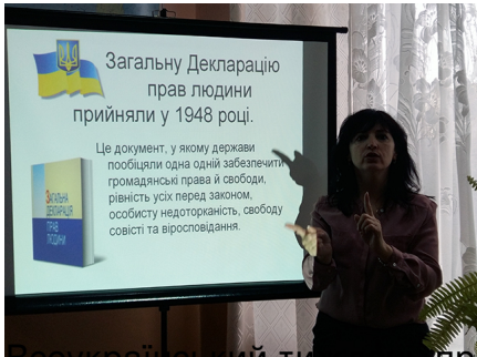
Інформаційний тиждень права