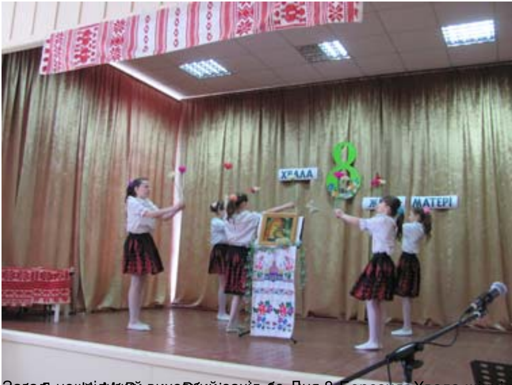
Діти виступили на сцені в День 8 Березня „Хвала жінці-матері” провела вихова