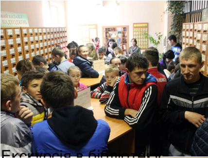
Екскурсія в бібліотеку