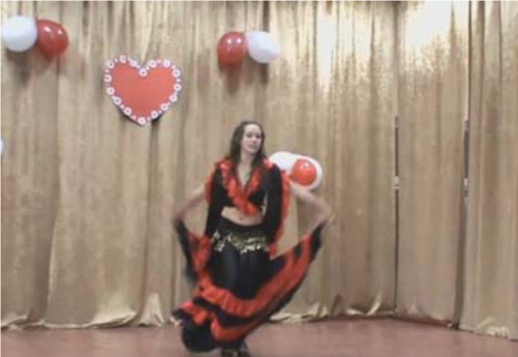
Виконання танцю в костюмі Бабі Біла. Під час виступу вчителька виконала танцювальні номери до Дня