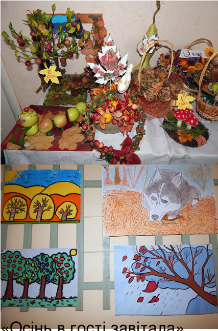
«Осінь в гості завітала»