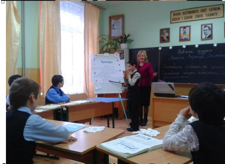
Батьки і діти вчаться разом у нашому фронті. Освітньо-виховний захід у школі-інтернаті