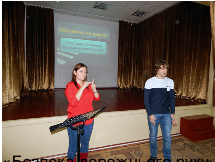
«Безпека дорожнього руху – це життя!»