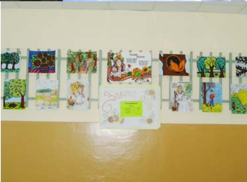
Щорічно проводиться виставка композицій з природного матеріалу „Золоті квіти осені”