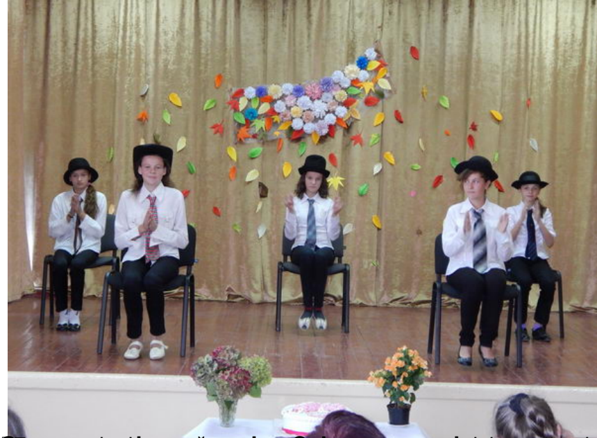
Батьківський гурток учнівської організації в сільському осінньому ярмарку. У ньому взяли