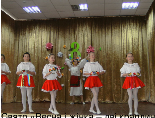
Свято «Весна і літня — дві краплини сонця»