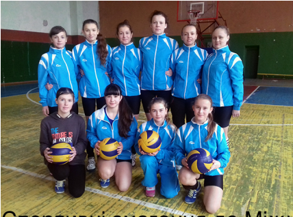
Спортивні змагання до Міжнародного дня інвалідів у спорткомплексі «Юність»