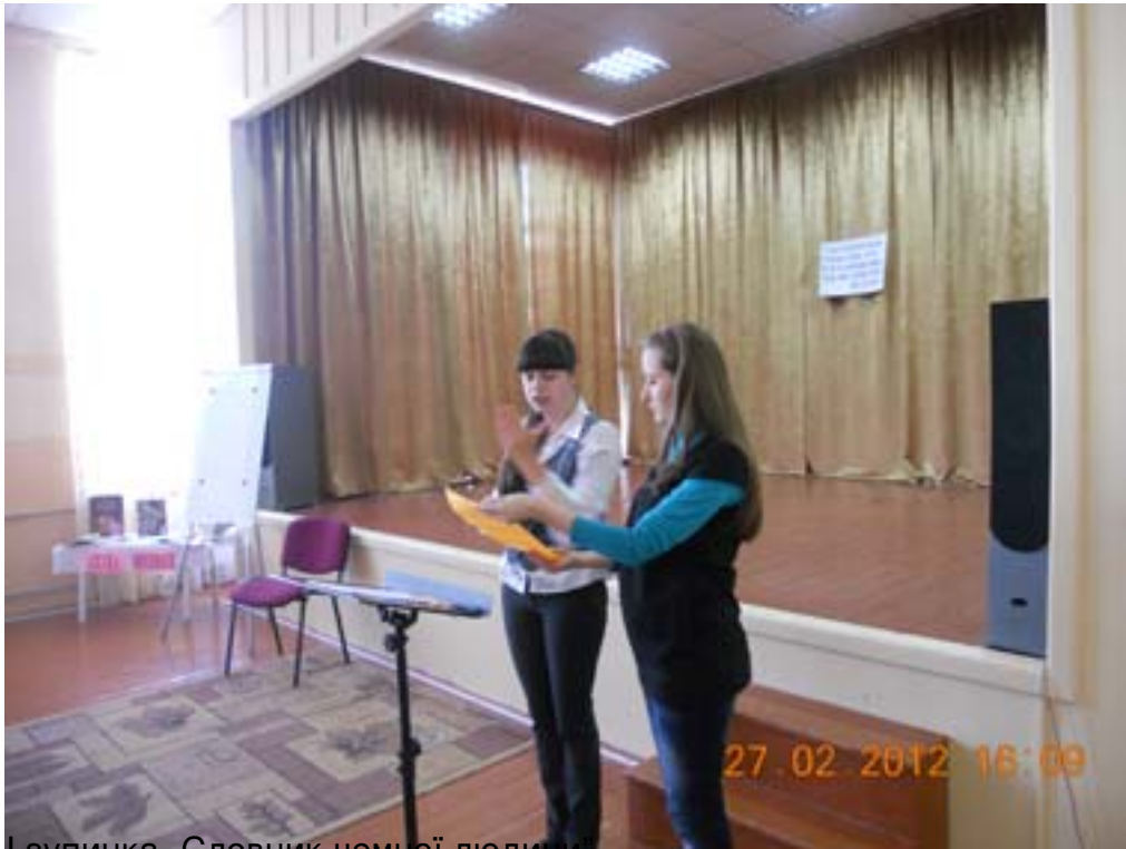
Групиця Словник немської мови