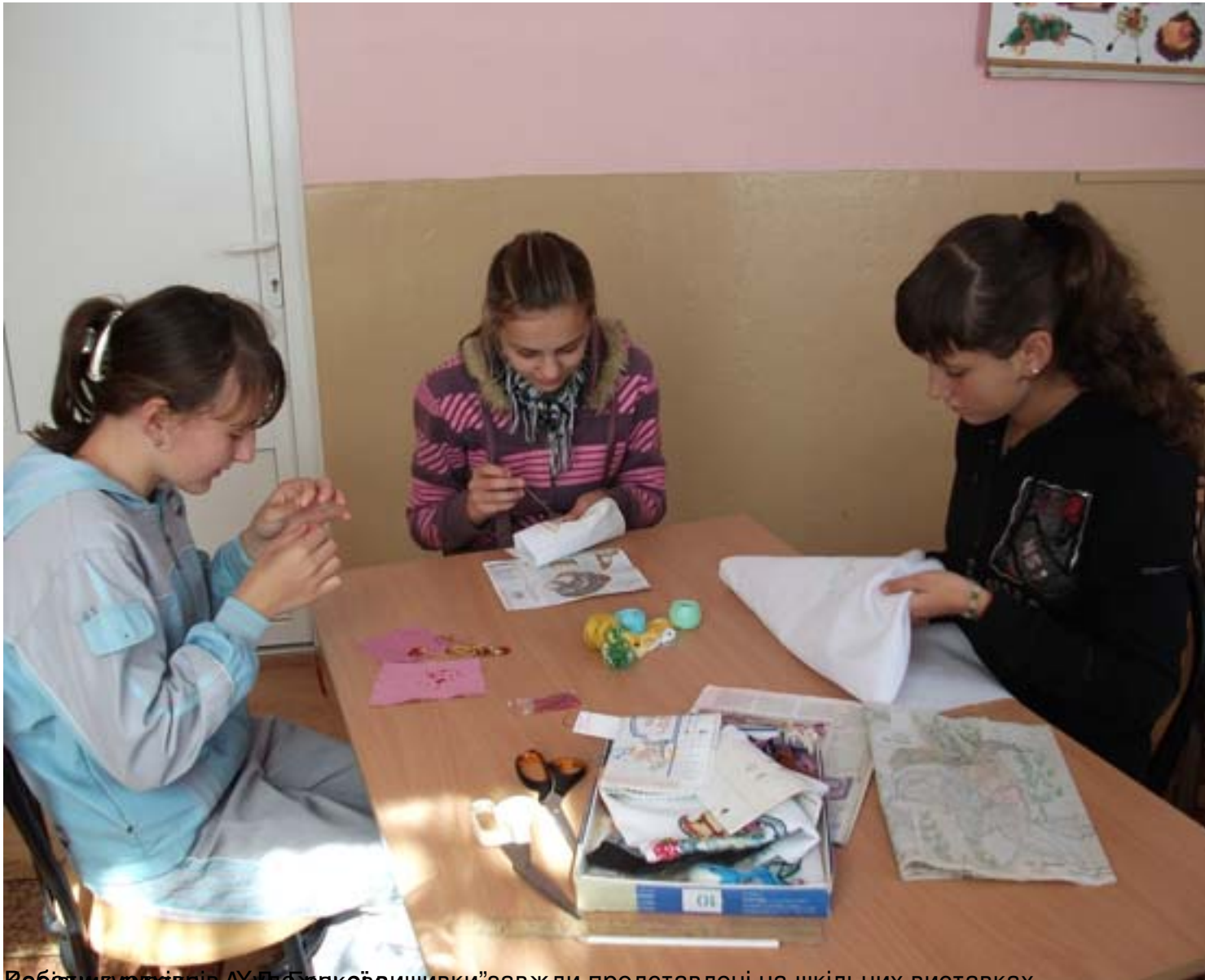
Роботи курців «Художковошивки» завжди представлені на шкільних виставках.