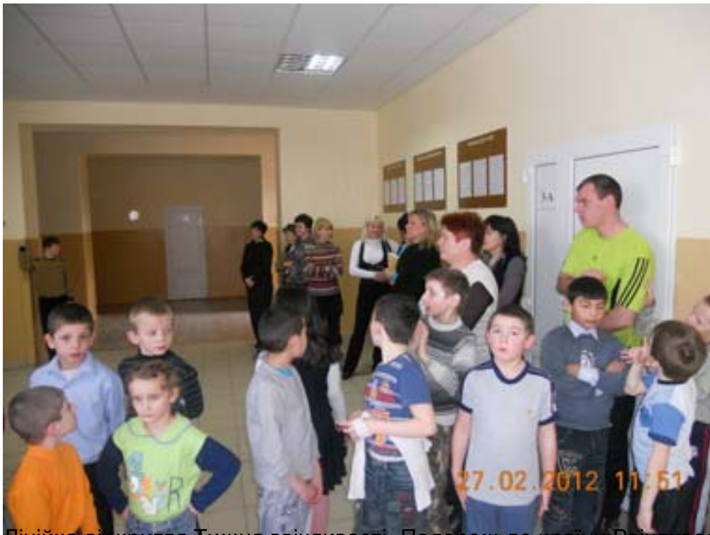
Лінійка-відкриття Тижня ввічливості "Подорож до країни Ввічливості"