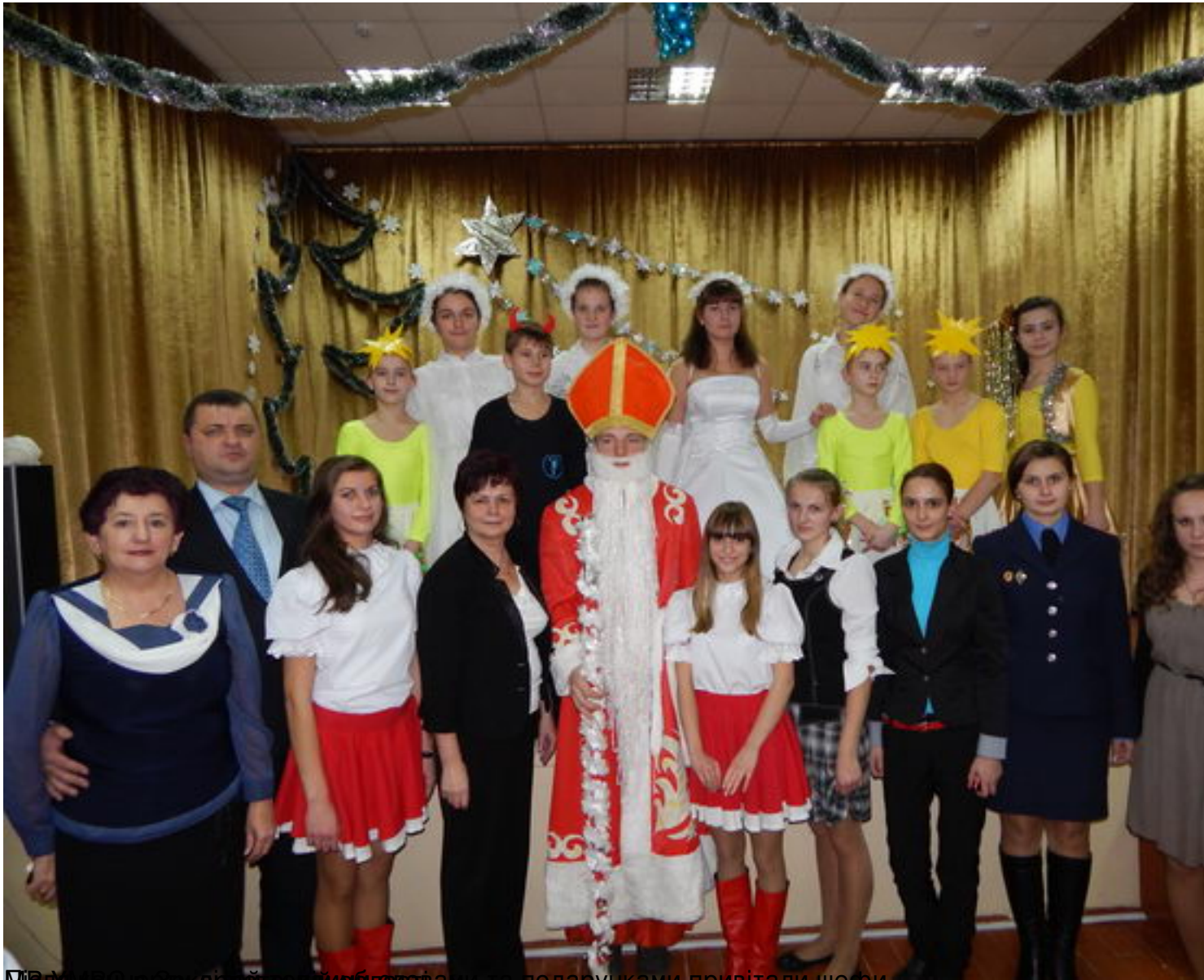
Міжкласові свята вчителів та батьків привітали шефи