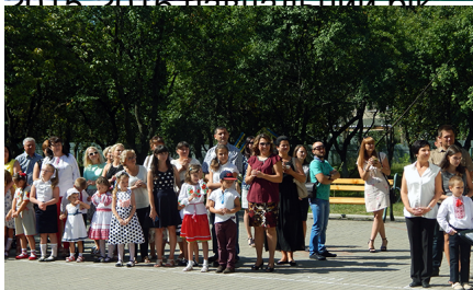
Уроциста піїїка «Першотравень кличе до школи»