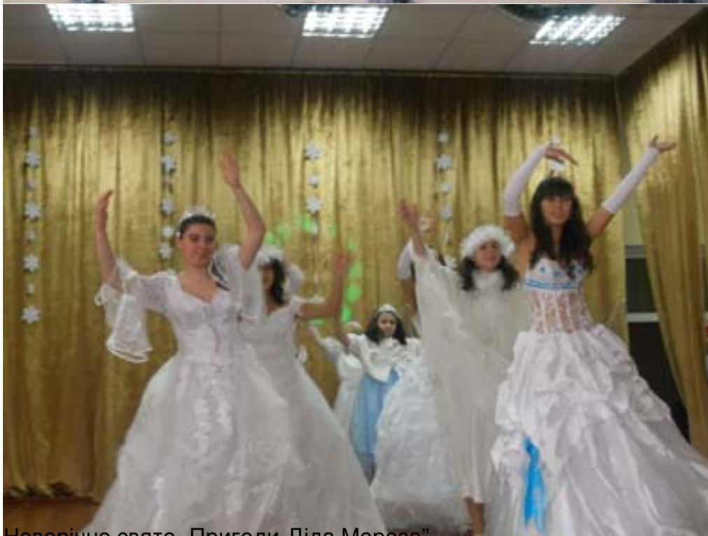
Новорічне свято „Пригоди Діда Мороза”