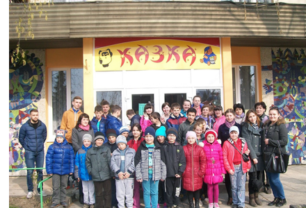
Екскурсія до Ужгородської міської бібліотеки для дітей «Казка»