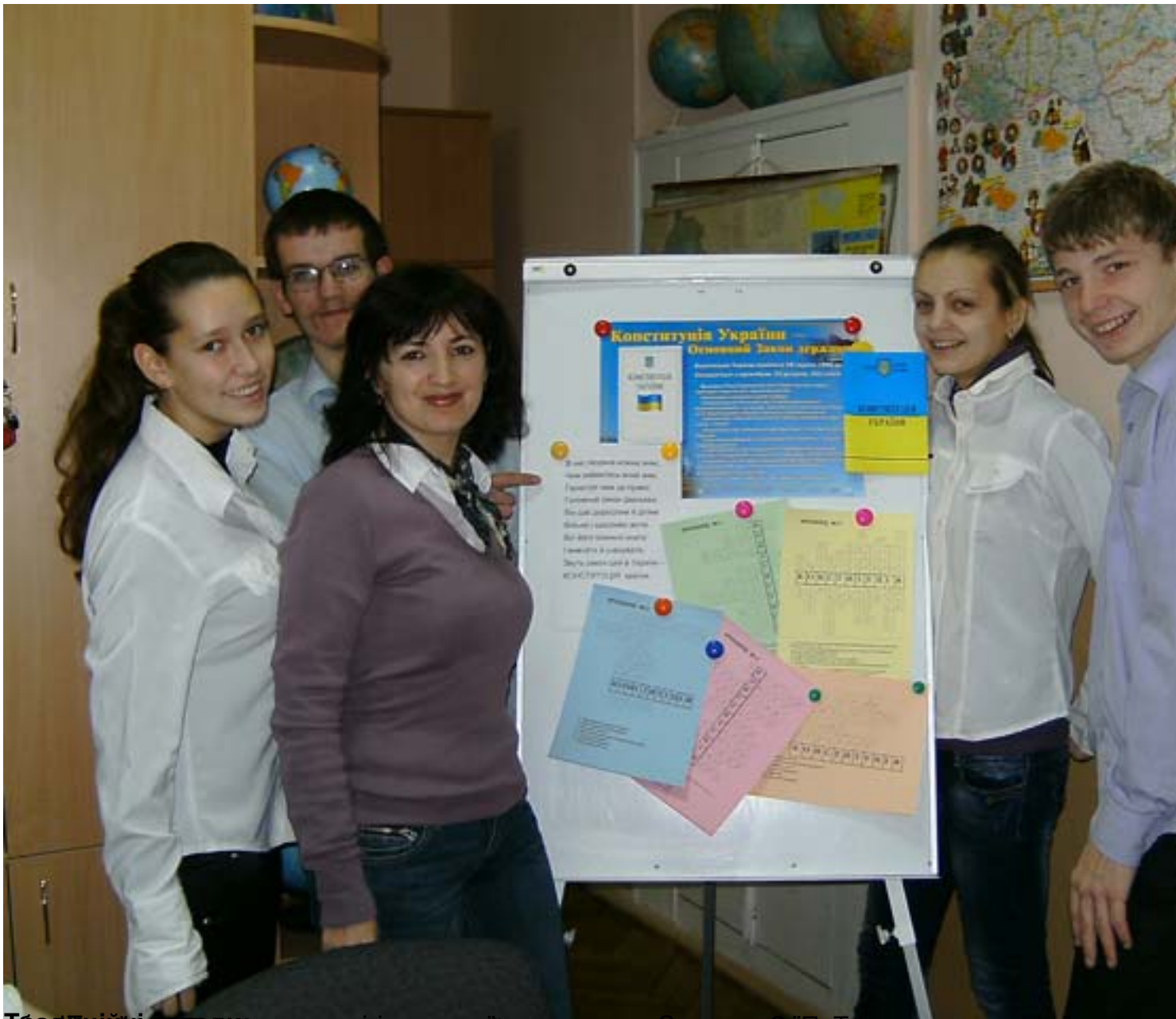
Тобто ми ніколи не втрачаємо зв'язку з традиціями, бо ми не тільки вивчаємо свої традиції, ми їх живимо, ми їх творимо, ми їх змінюємо, ми їх адаптуємо до своїх