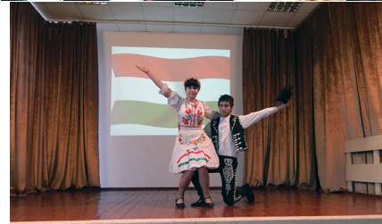
Міжнародний день інвалідів