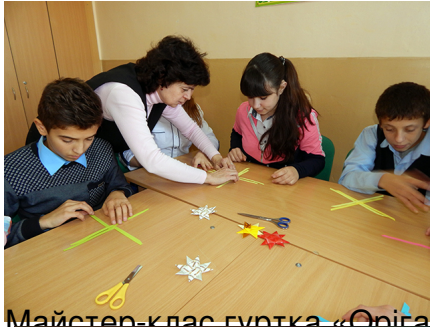
Майстер-клас гуртка «Орігамі та квілінг»