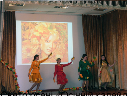
Виступи «Осінній калейдоскоп»