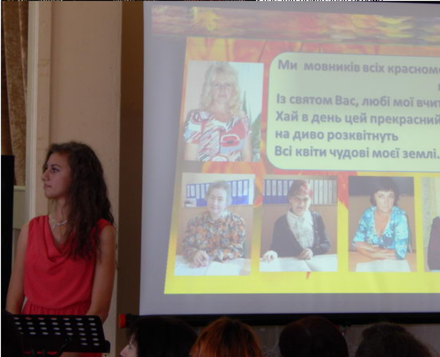
Чудова жінка мандалити віснів плід джебодулулу баксанмауннижилыбств насолудитися