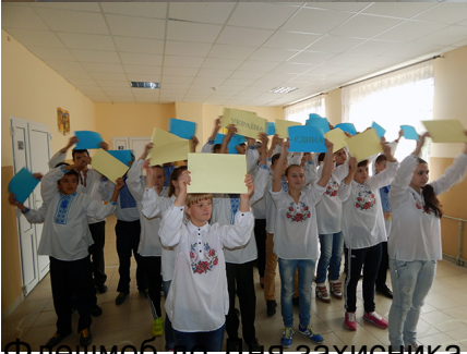
Флешмоб до дня захисника України «Україна єдина»