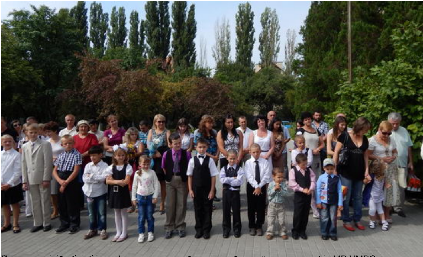
Урочистою кількістю вчителів та постійних гостей нашої школи, шефів МР УМРС в