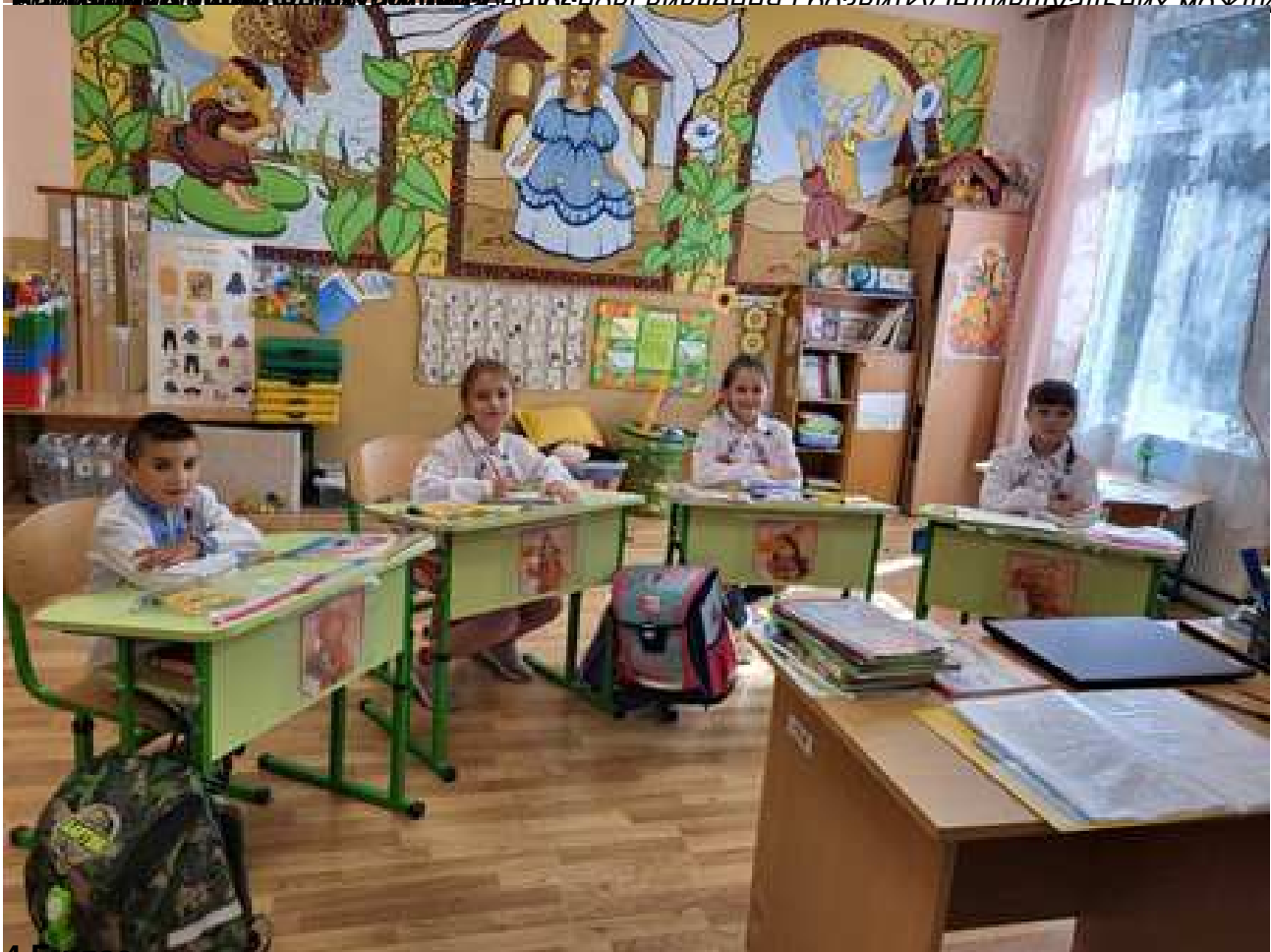
4 Б клас

Важливою метою педагогічної діяльності є виявлення і розвиток індивідуальних можливостей учнів