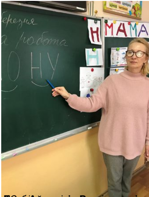
Методична група вчителів здійснює заходи з організації навчання в умовах воєнного стану та подолання стресу