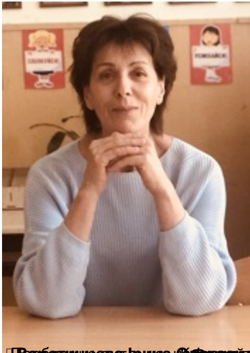
Проблемне завдання «Вплив міграцій на формування національно свідомої, морально стійкої особистості учня в умовах війни»